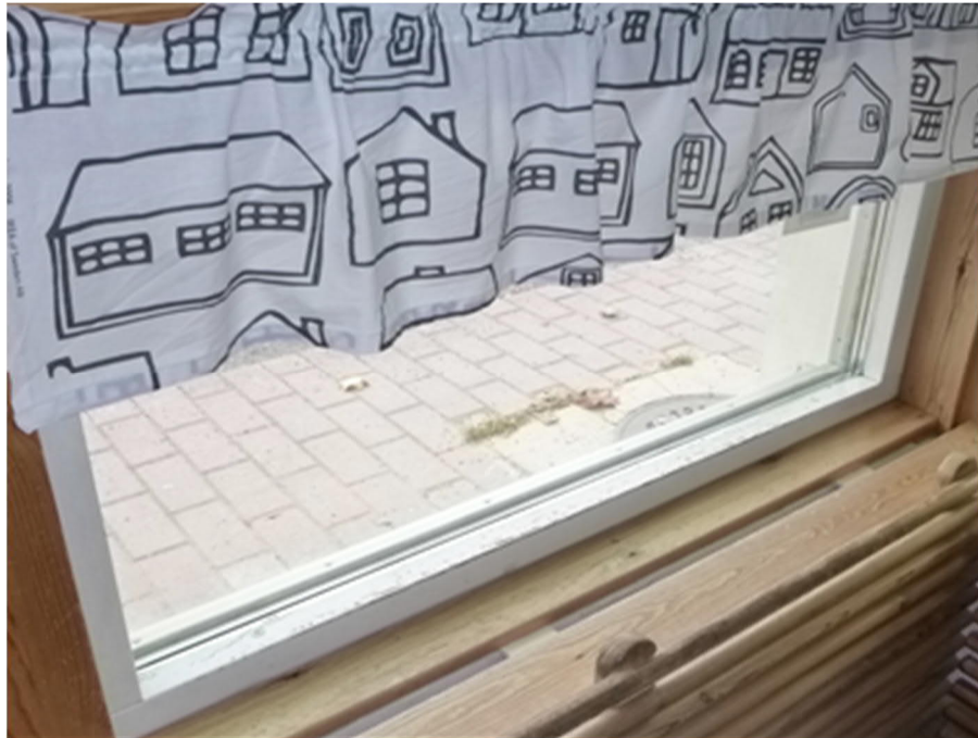
Kuva 1: Tyypillisiä kolhujen aiheuttamia vaurioita alhaalla sijaitsevien kiinteiden ikkunoiden alapuitteessa.