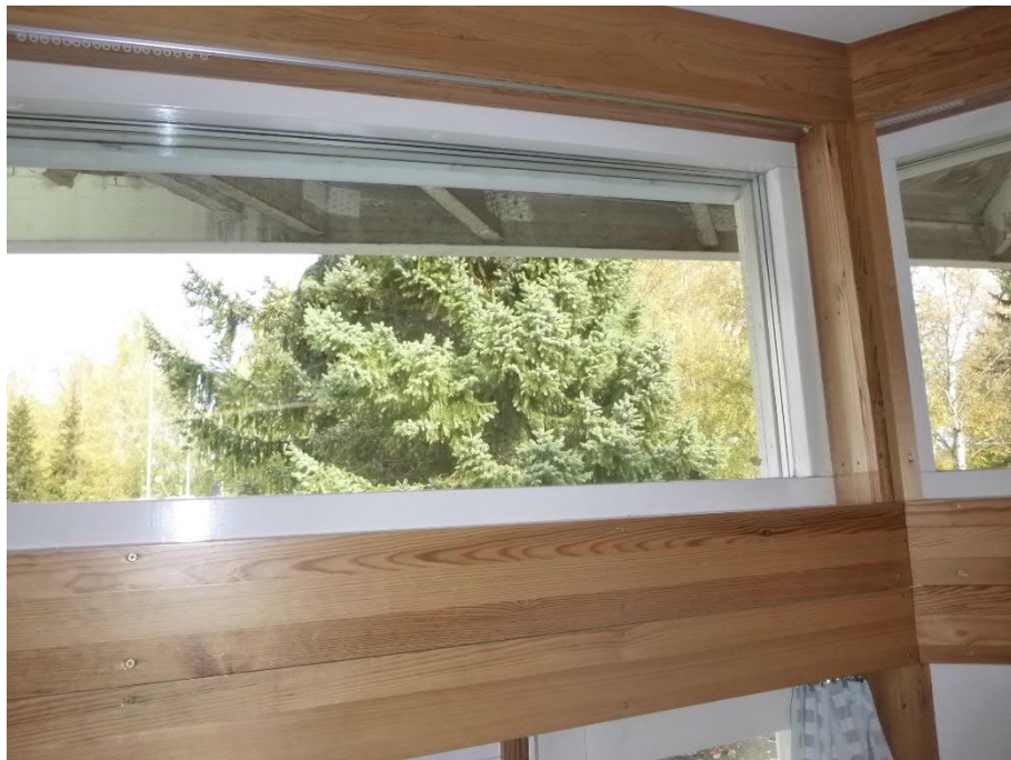
Kuva 7: Ylhäällä sijaitsevien kiinteiden ikkunoiden puuosat ovat tyydyttävässä kunnossa.