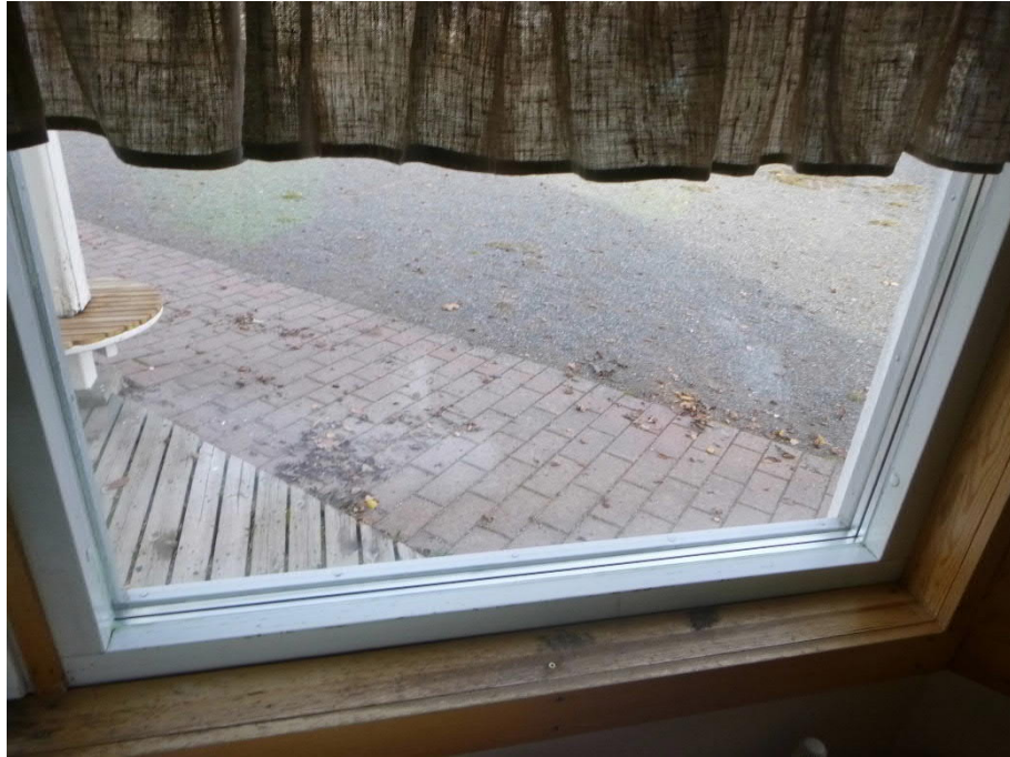
Kuva 4: Uusitun lämpölaselementin koko ei täysin vastaa alkuperäistä kokoa.