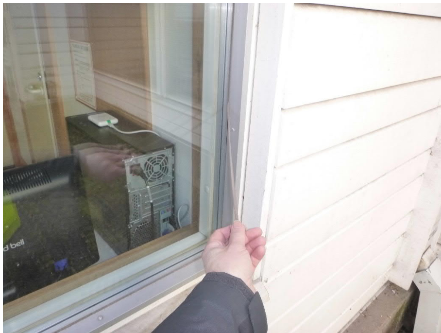
Kuva 11: Silikoni on irti alustastaan.