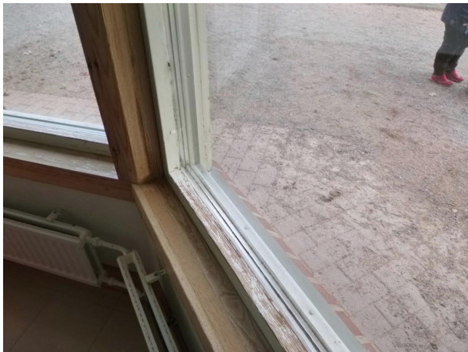
kuva 3: Osassa alapuitteita on kolhujen ja kosteuden aiheuttamia pinnoitevaurioita.