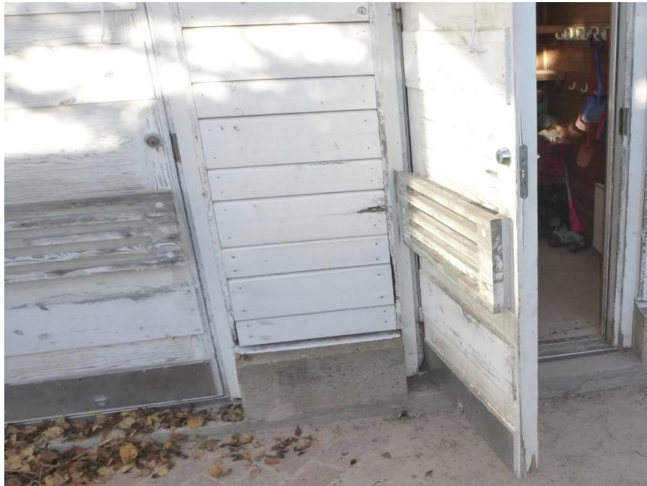
Kuva 14: Varastojen ovet ovat huonokuntoisia, maalipinnassa ja puuosissa on vaurioita.