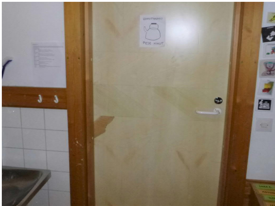
Kuva 17: Osassa väliovia on viilupinnan vaurioita.