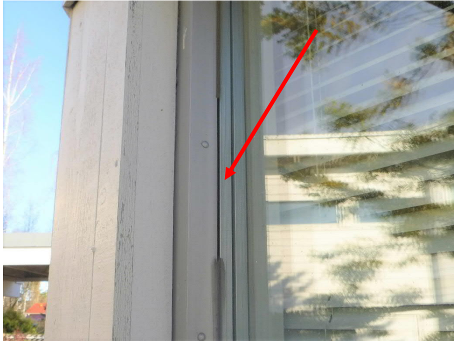
Kuva 10: Osa silikonitiivistyksestä on irronnut.