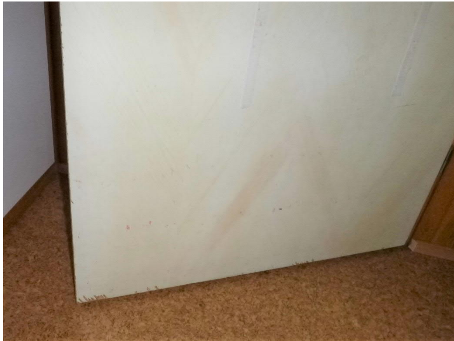
Kuva 16: Tyypillisiä vaurioita väliovessa: välioven alareunassa on kolhuja ja siivouksen aiheuttamaa likaantumista.