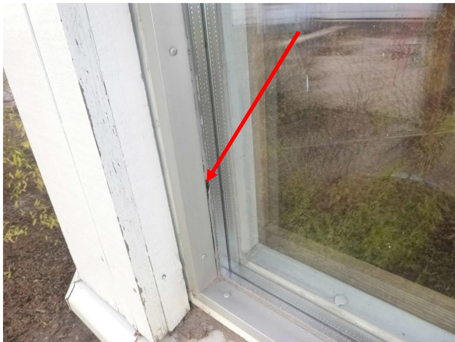
Kuva 9: Tiivistykseen käytetty silikonit on huonosti kiinni alustassaan.