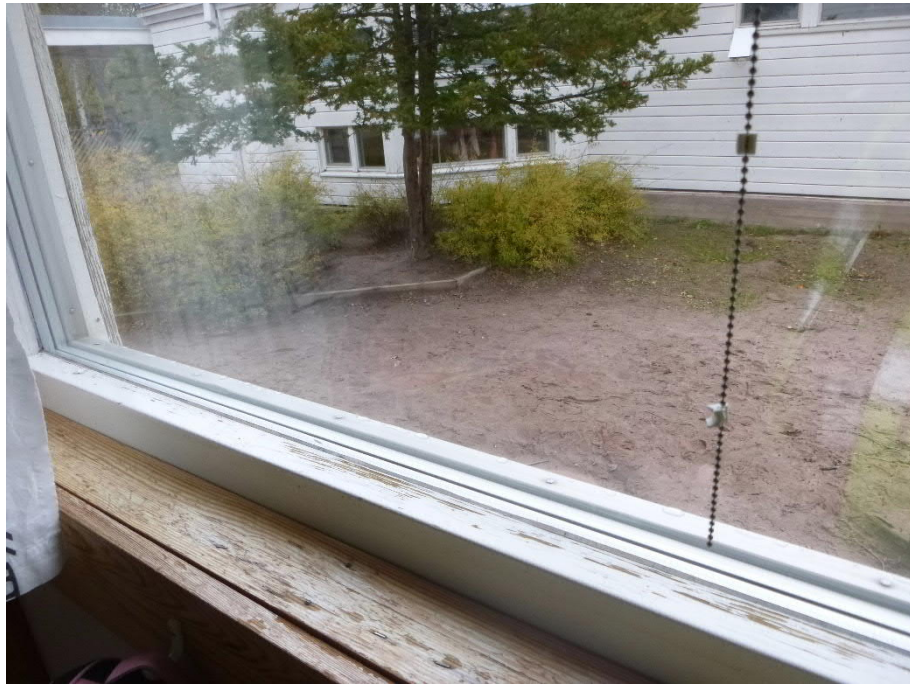
Kuva 2: Osassa alapuitteita on kolhujen ja kosteuden aiheuttamia pinnoitevaurioita.