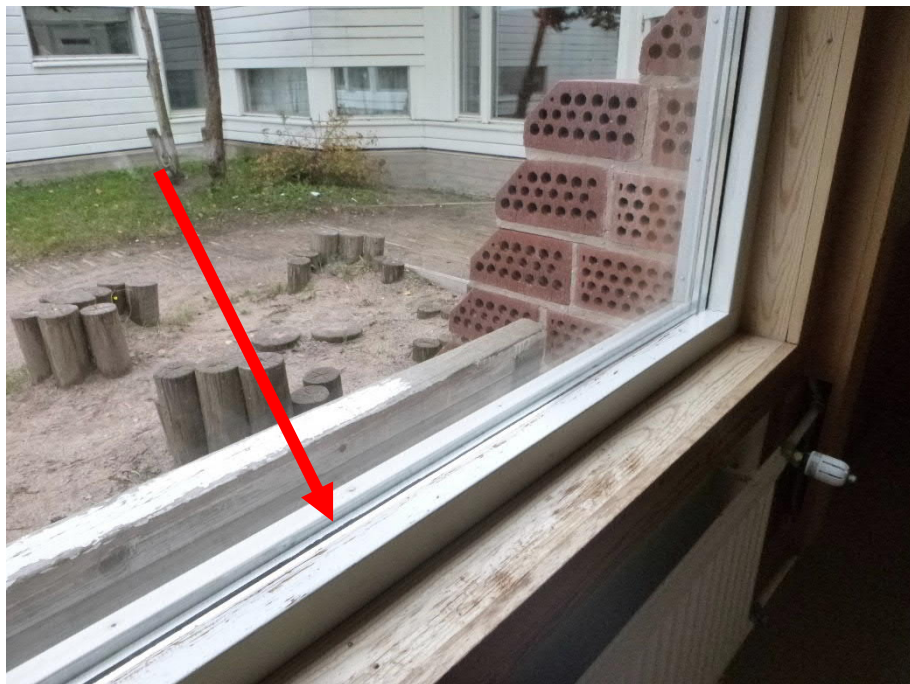
Kuva 5: Uusitun lämpölaselementin koko ei täysin vastaa alkuperäistä kokoa.