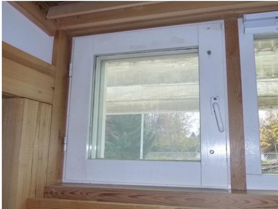
Kuva 8: Osassa avattavia ikkunoita puuosat ovat tyydyttävässä kunnossa, pokien välissä ja laseissa on likaa tiivisteiden epätiiveyden takia, salpa on useassa ikkunassa käynniltään väljä.