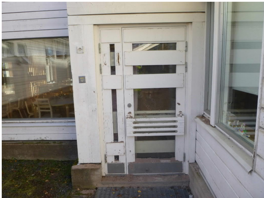
Kuva 13: Ulko-ovet ovat välttävässä kunnossa. Maalipinnassa ja puuosissa on kulumaa, ovien käynti on huono, ovet "roikkuvat".