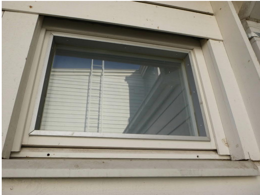
Kuva 12: Avattavat ikkunat: ulkopuolisissa listoituksissa tai pellityksissä ei ole merkittäviä puutteita.