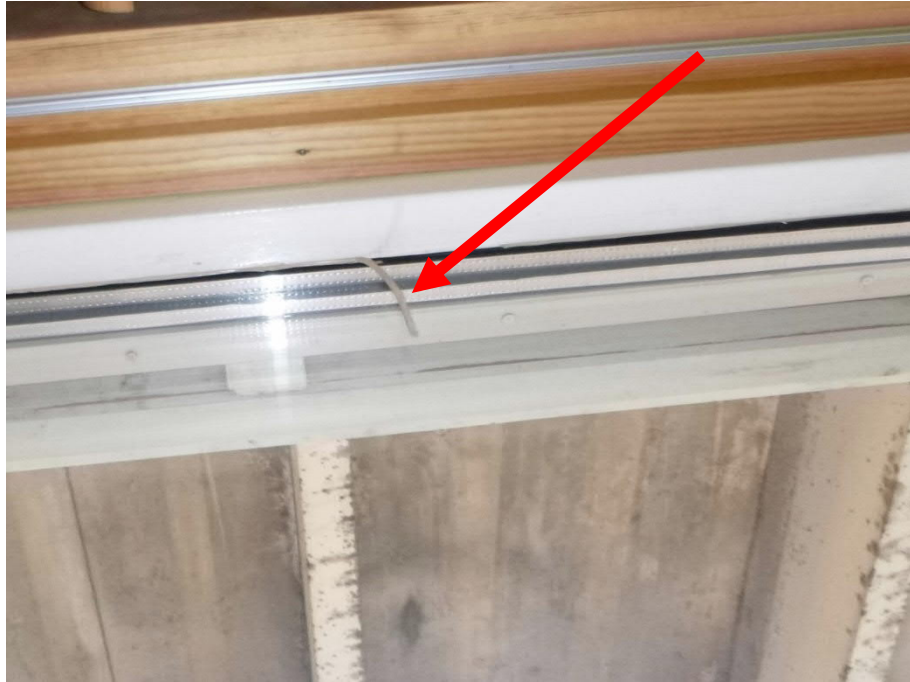
Kuva 6: Tiivistykseen käytetty silikoni on huonosti kiinni alustassaan.